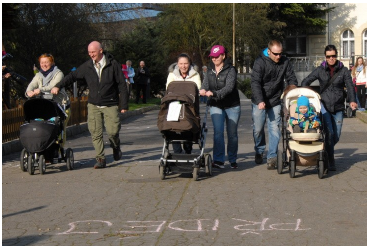
Závody kočárků - výtěžek věnován na kroužek pro hendikepované děti