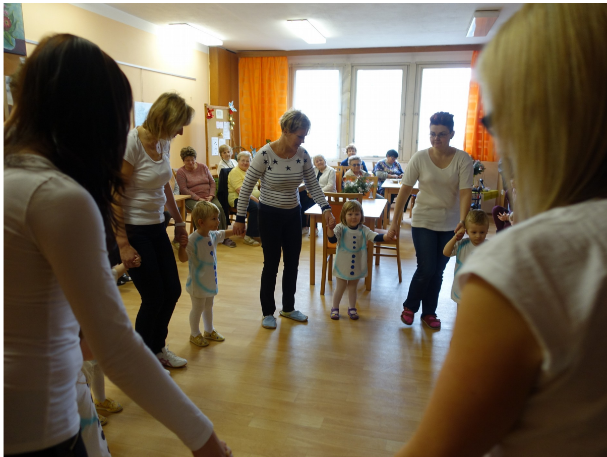
Vystoupení v Domově pro seniory