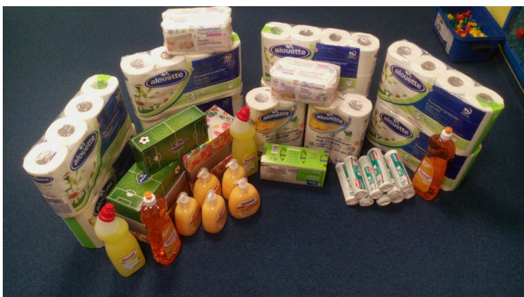
Sponzorský dar od společnosti Rossmann - Spolu pro MC Sítě MC